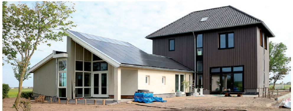
Alleen nog energieneutrale woningen in 2050

Gemeenten helpen we bij het opstellen en uitvoeren van en communiceren over gemeentelijke subsidieregelingen voor energiebesparing. Wilt u weten wat de RUD NHN samen met uw gemeente of regio kan doen om de energietransitie in de bestaande woningbouw te versnellen? Neem dan contact op met mevrouw B. Harskamp via bharskamp@rudnhn.nl .