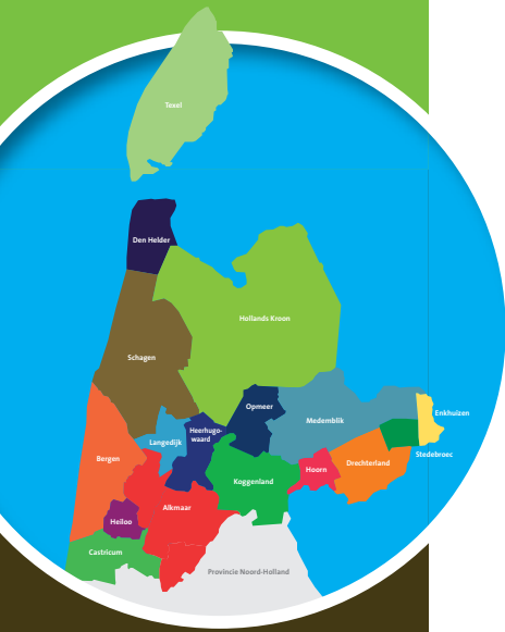
Werkgebied RUD NHN

In 2015 is de RUD NHN gestart met een pilotproject om te komen tot verbetering van de informatie-uitwisseling richting raden: "Grip op regionale samenwerking". Dit is geconcretiseerd in onze Kaderbrief 2017. Inhoudelijk bestaat deze uit een beschrijving van de autonome ontwikkelingen waarmee de deelnemers en de RUD NHN te maken hebben. Dit betreft de te verwachten conjunctuurschommelingen en de voorbereiding op de Omgevingswet. Ook zijn speerpunten voor de uitvoeringstaken (asbest, ketentoezicht en duurzaamheid) benoemd. Daarnaast gaat het om onderzoeken naar outputfinanciering versus de huidige lumpsumbijdrage en de inbreng van meer of minder taken op termijn. Ook is ingegaan op de loon- en prijsindexatie. Deze onderwerpen worden in 2017 en 2018 uitgewerkt.