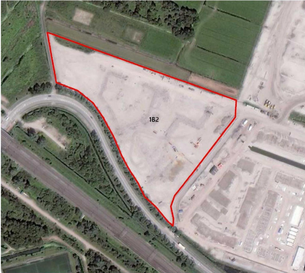
Afbeelding 1 Bouwveld 1B2 (situatie 29 juni 2019) met amfibiescherm (rode contour)

amfibieën. Een andere verklaring is dat de weersomstandigheden op 26 september 2019 waarschijnlijk gunstig waren (warm en vochtig) aangezien er op 26 september 2019 in alle bouwvelden redelijk hoge aantallen amfibieën werden aangetroffen.