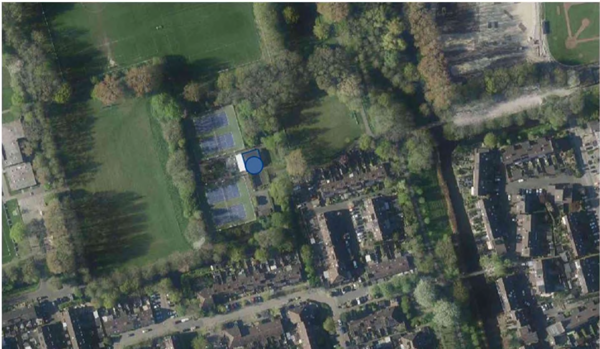
Figuur 1 Situering Tennisvereniging De Balletuin en omgeving

In figuur 1 is de ligging van de tennisvereniging ten opzichte van de omgeving gegeven. Voor dit onderzoek is de situatie doorgerekend met vier tennisbanen en twee padelbanen. Deze situatie is weergegeven in figuur 2. De geplande padelbanen liggen daarbij op een afstand van meer dan 100 m van de woningen.