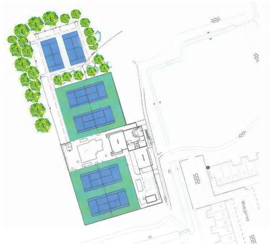
Figuur 2 Lay-out met twee nieuwe padelbanen ten noorden van de tennisbanen