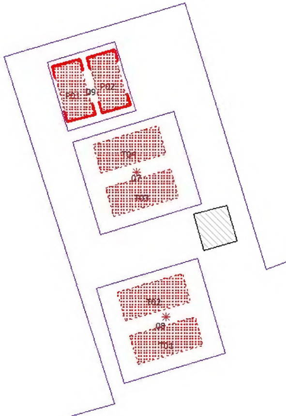
Figuur 4 Ligging geluidbronnen tennis en padel (rood gearceerde vlakken) en schermen rond padelbanen (rode lijnen)