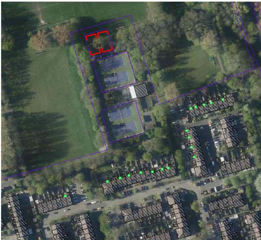
Figuur 3 Ligging tennisvereniging met geluidsbronnen en beoordelingsposities (overzicht)

De berekeningen zijn uitgevoerd met het programma Geomilieu V2023.3 en conform de Handleiding meten en rekenen industrielawaai. In figuur 3 en 4 zijn de geluidsbronnen voor de tennis- en padelbanen (rode vlakken) en de beoordelingsposities bij de geluidgevoelige bestemmingen weergegeven (groene stippen). De wanden van de padelbanen zijn als rode lijnen weergegeven.